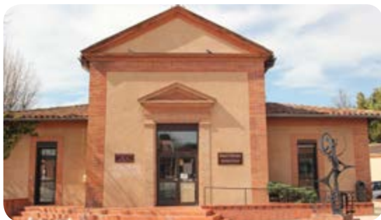
> la façade de la bibliothèque actuelle ne sera pas modifiée